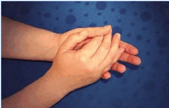
1. Schritt: Handfläche auf Handfläche reiben

Die Händedesinfektion soll nach folgendem Ablauf im Team unterrichtet, trainiert und durchgeführt werden, weil nur bei diesem Vorgehen alle Flächen der Hand sicher erfasst werden: