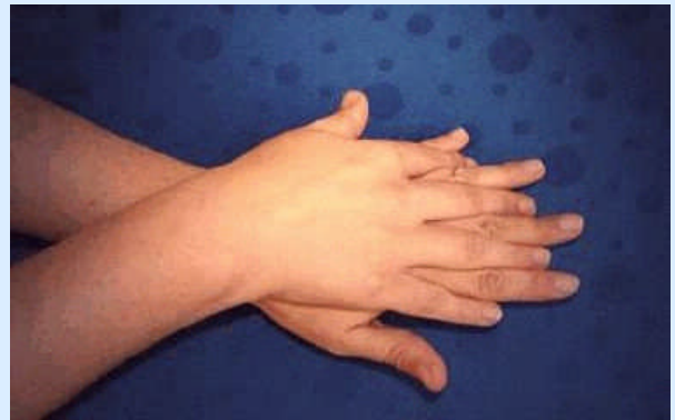
2. Schritt: Rechte Handfläche über linkem und linke Handfläche über rechtem Handrücken reiben