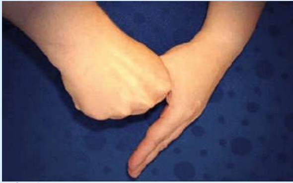
5. Schritt: Einreiben des rechten und linken Daumens