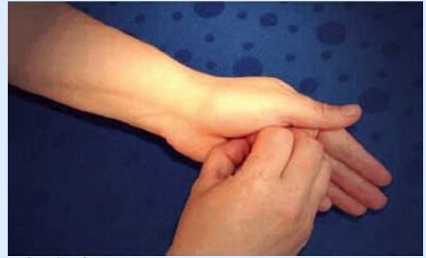
6. Schritt: Geschlossene Fingerkuppen in die rechte und linke Handfläche reiben

Typische Situationen zur Durchführung der hygienischen Händedesinfektion sind gegeben