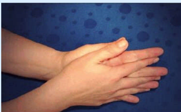
3. Schritt: Handfläche auf Handfläche mit verschränkten, gespreizten Fingern